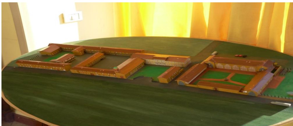
Plastico della cascina " La Poglianasca ". La Ca' luigi è sulla destra.